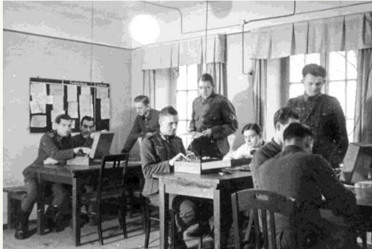
Занятая школа немецко-фашистскими захватчиками