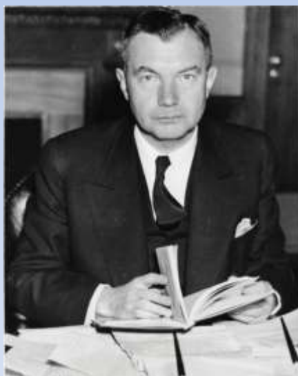
Роберт Х. Джексон