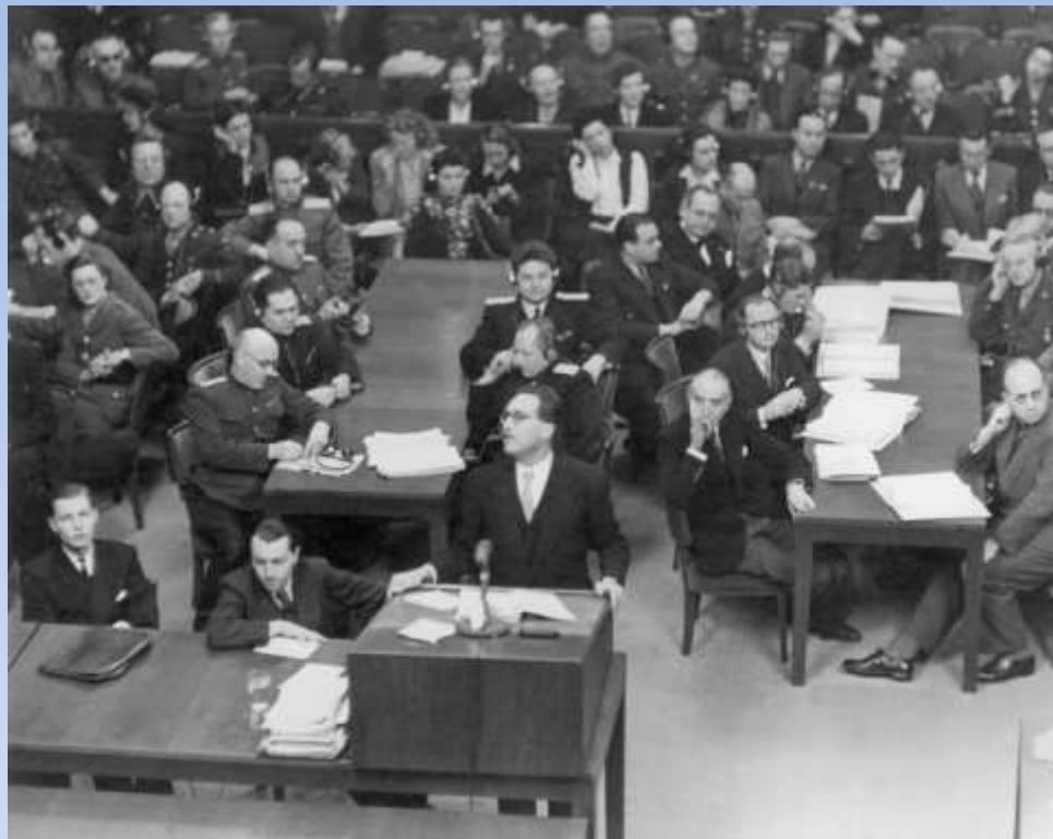
Франсуа де Ментон