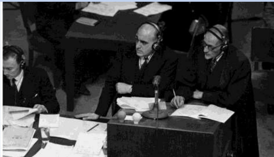
Дэвид Макссуэлл-Файф (в центре) за трибуной обвинения в зале № 600 Нюрнбергского дворца правосудия