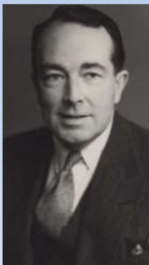
Сэр Хартли Шоукросс